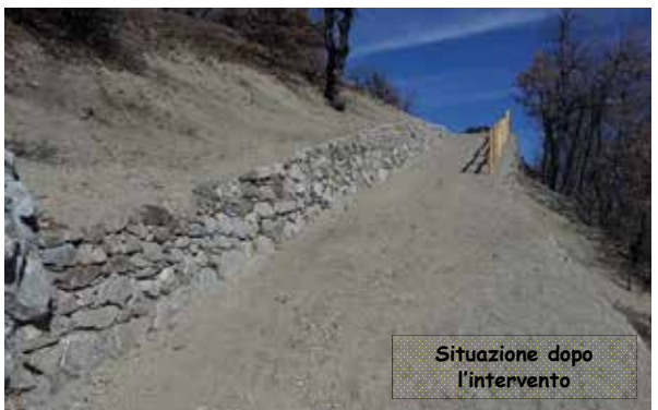
Situazione dopo l'intervento