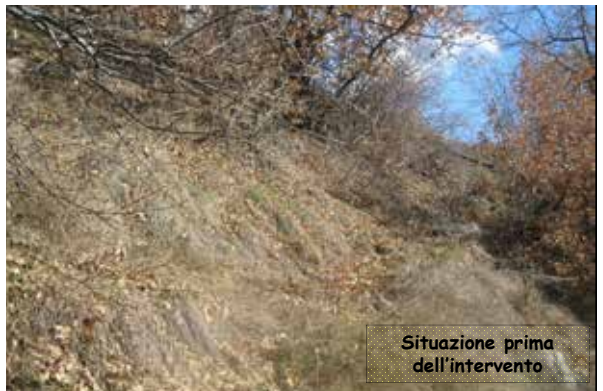
Situazione prima dell'intervento

L'intervento rientra nel programma lavori della stagione 2015 che il Comune di Saint-Christophe segnala ogni anno all'Assessorato Agricoltura e Risorse Naturali Struttura Forestazione e Sentieristica.