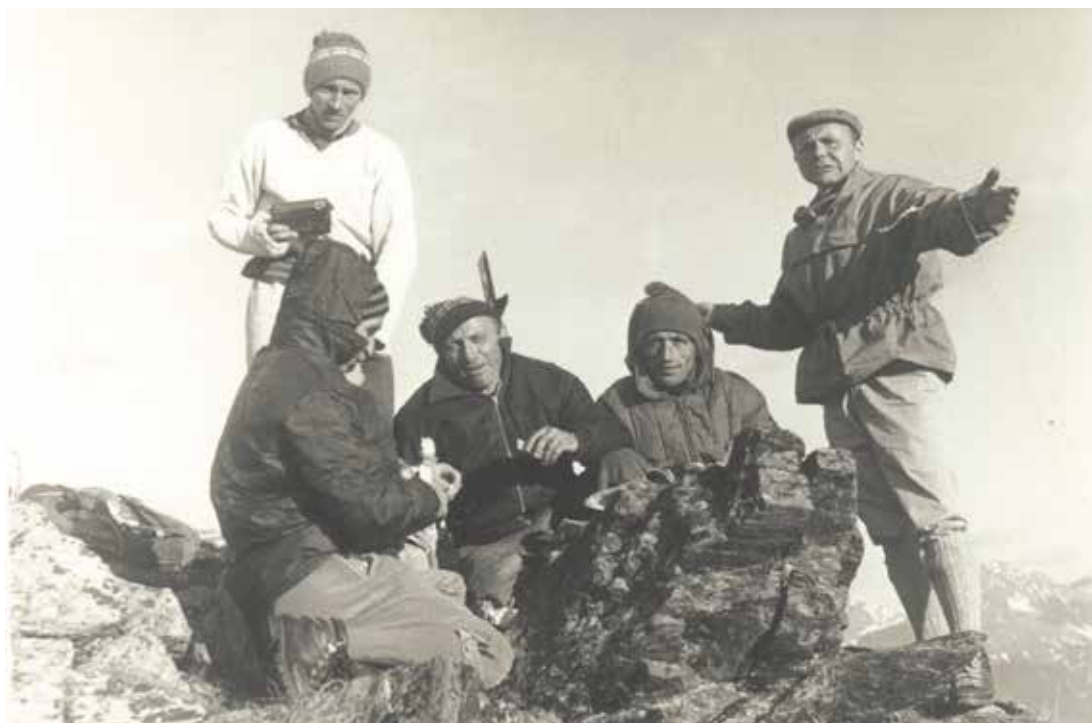
LE SEUNCANT'AN DI FOUÀ DE SEN PIÈRE SU LA BECCA DE VIOÙ