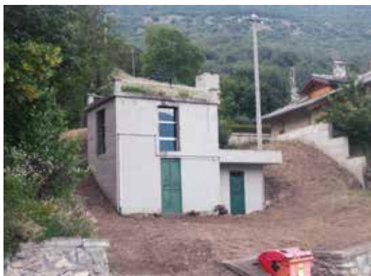
Vasca di Rouye

ci permetterà di impiegare per tutto il periodo estivo persone disagiate, che hanno svolto e svolgeranno un lavoro molto prezioso per il mantenimento dell'ordine e della pulizia del nostro comune. Nello stesso tempo sono stati contenuti i costi a carico dell'amministrazione comunale e di tutti i cittadini. La spesa complessiva è stata di euro 10.000,00.