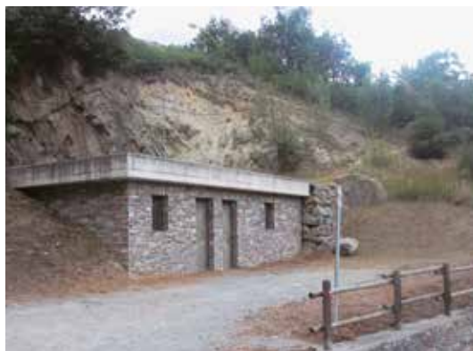
Vasca di Veynes