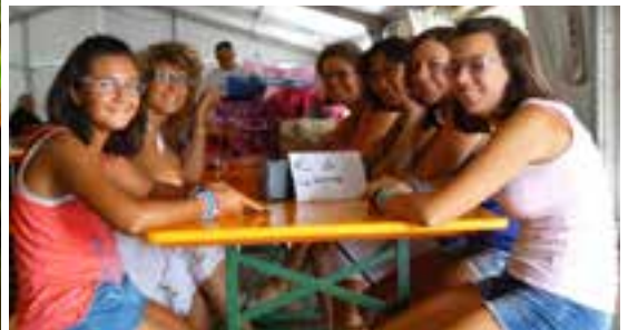
Distribuzione dei dolci