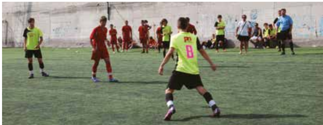
Edizione 2013 della 24 ore di calcio a 5 con 29 squadre