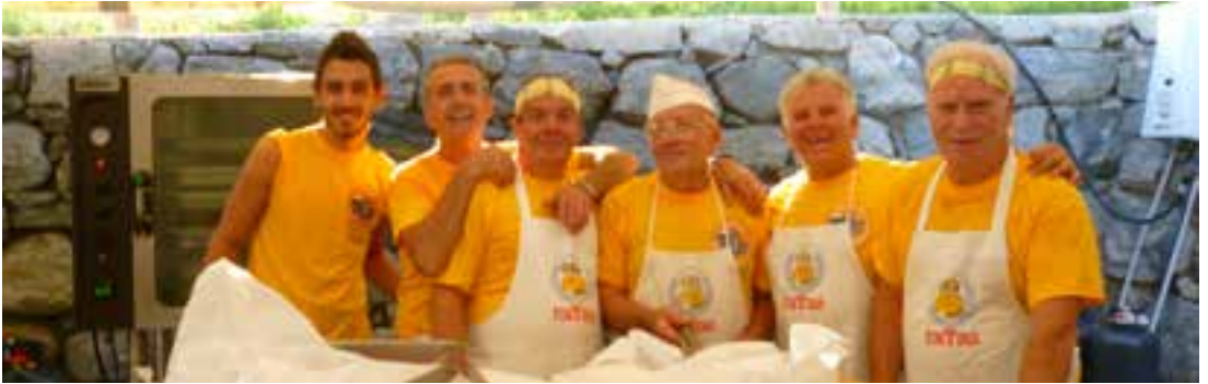
I volontari in cucina